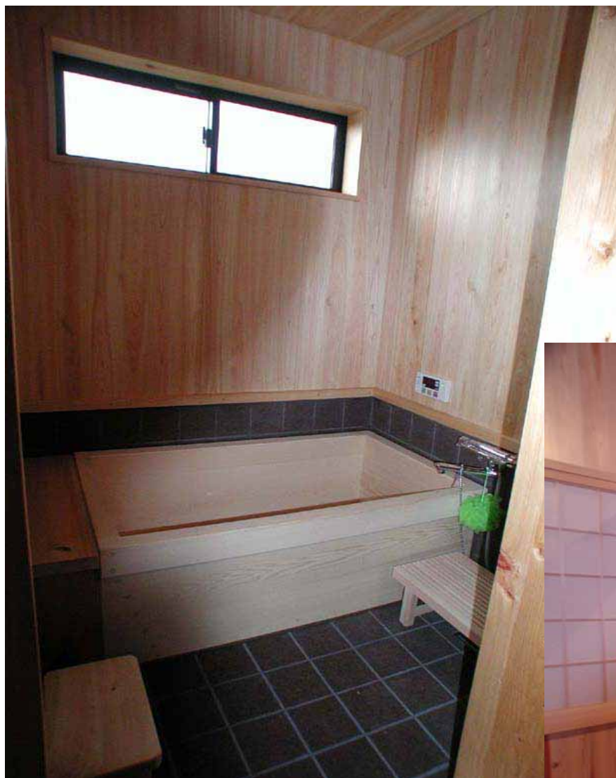
ご主人のこだわり、高野槇の 浴槽とコルクタイルのお風呂