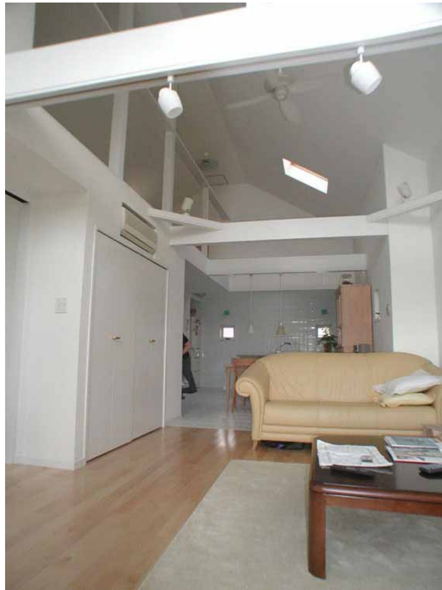
内部もシロが中心です！ 奥の壁は輸入タイル、床はタイルに床暖房。