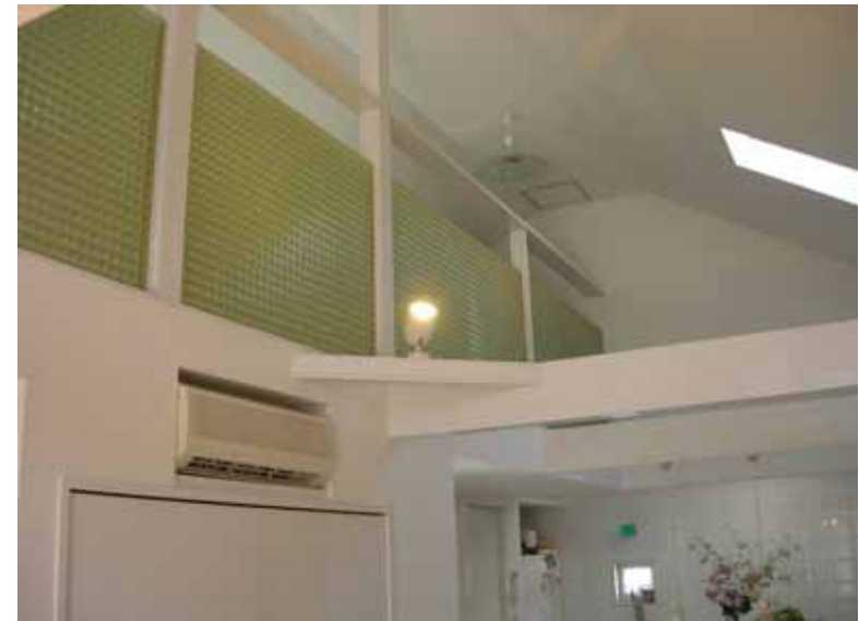
ロフトの手摺に目隠し完了！ 全開口サッシの向こうに待望 のデッキスペースが・・・