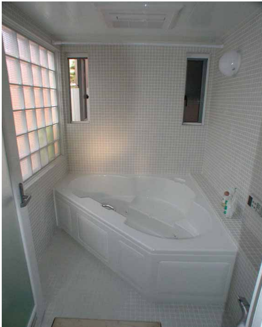
ガラスブロックと白いモザイクタイル、直輸入のジェットバス、こだわりの空間です